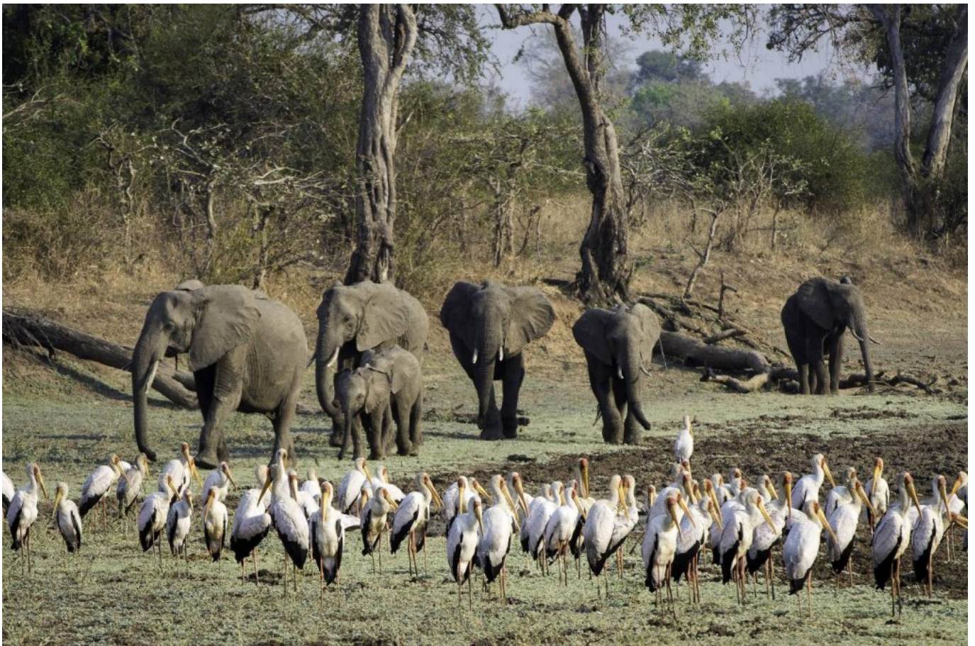
Elies and yellow billed storks

Anche elefanti , tsessebe, reedbuck, oribi e sitatunga si sono adattati a quest'area e possono essere avvistati in gran numero, e nelle lagune e nei fiumi dove si possono vedere gli ippopotami e coccodrilli che si nascondono nei canneti.